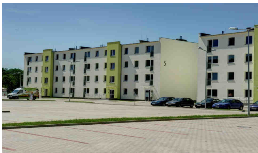
ul. Andrzeja Łaskarza 3, 5, 7