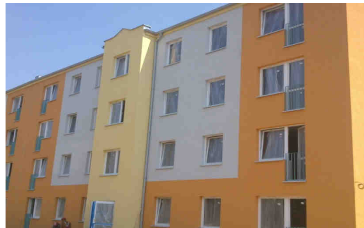
ul. Bolka 8