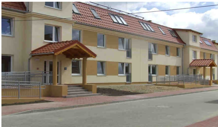
ul. Głuszyna 123, 123a, 123b, 123c